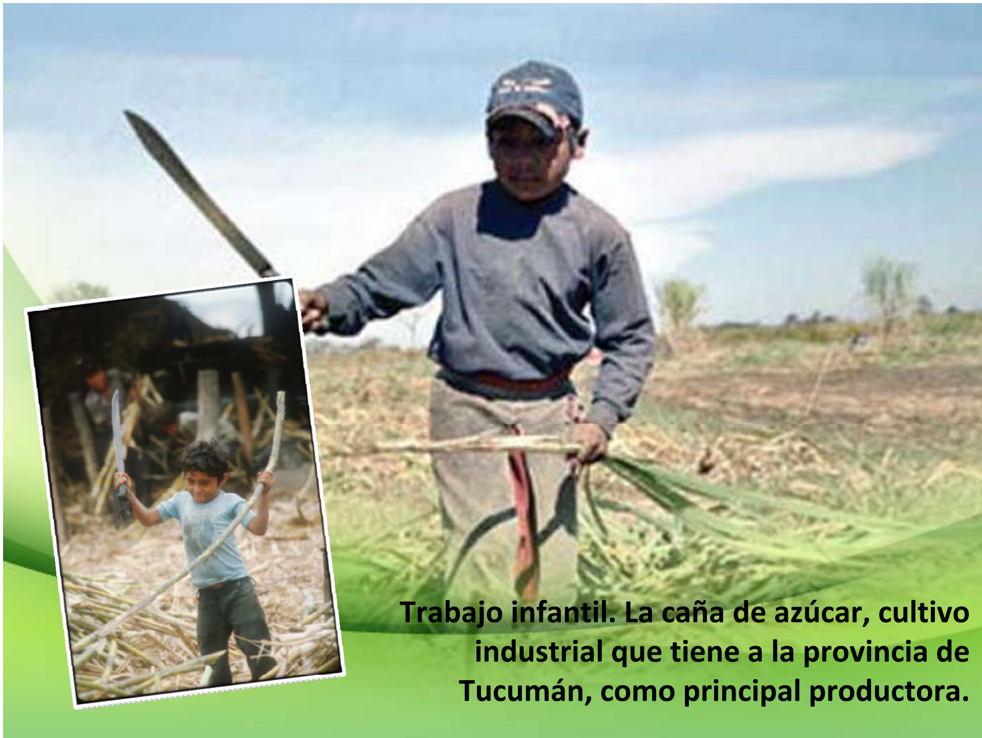
Trabajo infantil. La caña de azúcar, cultivo industrial que tiene a la provincia de Tucumán, como principal productora.