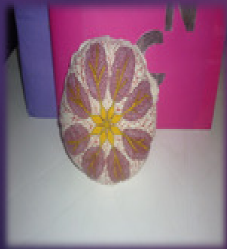
MAMA DE TELA