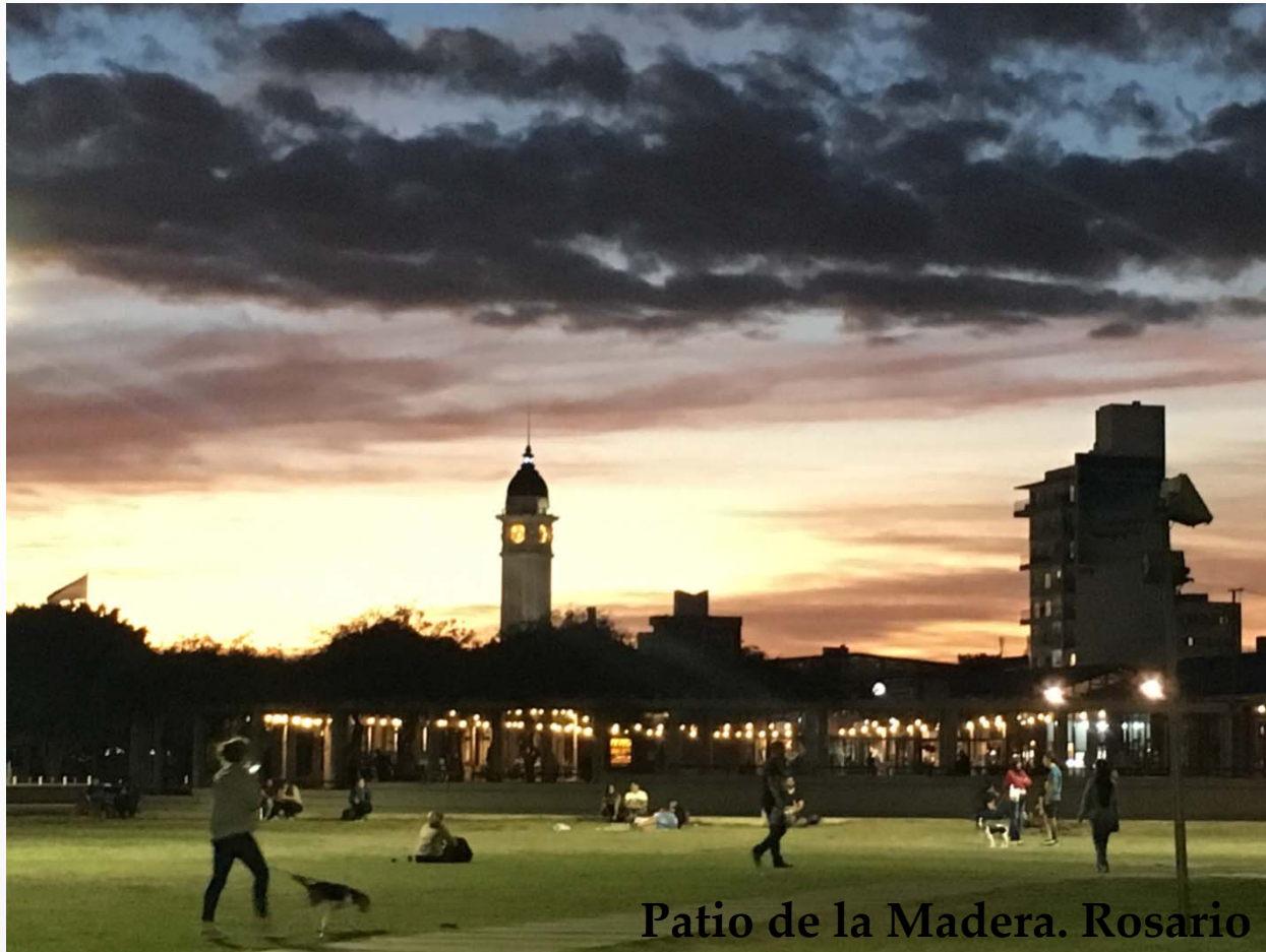
Patio de la Madera. Rosario