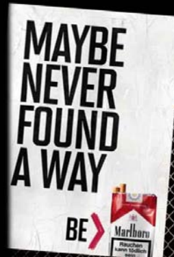
Be Marlboro: Germany