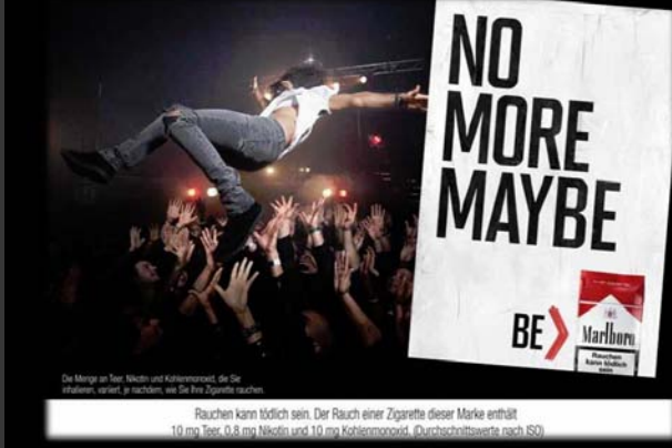
Be Marlboro: Germany

Die Menge an Teer, Nikotin und Kohlenmonoxid, die Sie inhalieren, variiert je nachdem, wie Sie Ihre Zigarette rauchen.