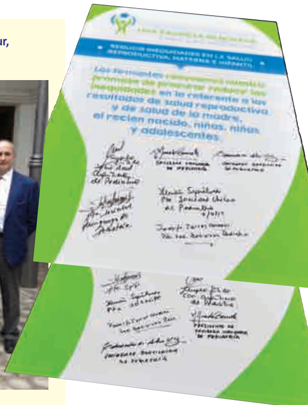
El poster, especificando los aspectos centrales del Acuerdo, fue firmado por los Presidentes que integran el Foro de Pediatría del Cono Sur.