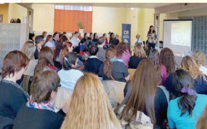
Importante convocatoria en las Jornadas de capacitación en TBC Infantil y Juvenil

Tal como se había programado se realizó en Posadas, Misiones el día 22 de abril la capacitación en TBC infantil y del adolescente dentro del Plan de trabajo para la Tuberculosis infantil: Hacia cero muertes, hacia cero abandono del tratamiento