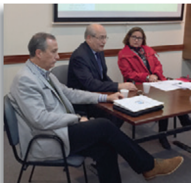
Las autoridades de la SAP abrieron la jornada.