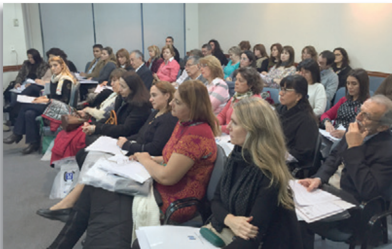
Autoridades de todas las Filiales y Delegaciones compartieron un diagnóstico de situación, y proyectaron acciones conjuntas.