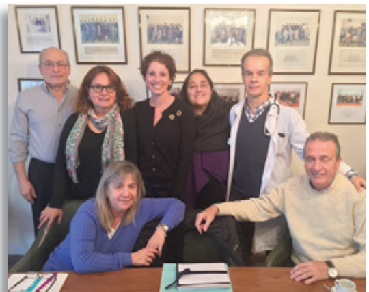
El Grupo de Trabajo de la SAP sobre Enfermedades Poco Frecuentes, propició el vínculo con la Fundación FADEPOF.

Siguiendouno de los principales ejes de la gestión de la SAP, Salud sin Daño se suma a las acciones de promoción del cuidado de las exposiciones a tóxicos ambientales durante la gestación y en los primeros años de vida, dado que ciertos químicos pueden impedir un adecuado desarrollo o producir enfermedades crónicas en el curso de la vida.