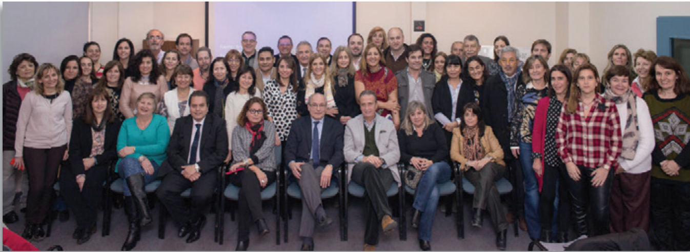
Pediatras de todo el país, fortalecen juntos su compromiso por un niño sano en un mundo mejor.

actividad entre todas las Filiales de cada Región a fin de fortalecer, de manera federal, este eje de gestión.