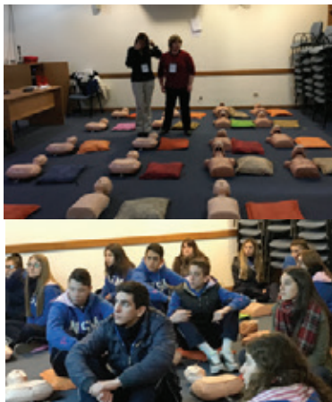
Taller de RCP para adolescentes en las 4ª Jornadas de la SAP de Actividad Física y Deportiva para el niño y el adolescente

Destinados al programa de Emergencias y Reanimación Avanzada (ERA), la Sociedad recibió materiales didácticos, muñecos para los cursos de RCP, gestionados por Fundasap.