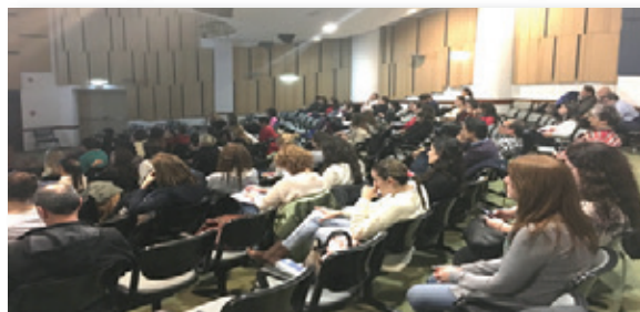
Más de cien pediatras participaron en la Jornada.

Teniendo en cuenta el interés manifestado y la respuesta a la convocatoria, la Jornada se incorporará al calendario de actividades anuales del Comité Nacional de Neumonología de la SAP.