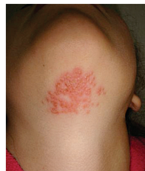
FIGURA 2. Placa costrosa supralabial derecha