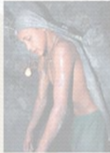
Mines are an extremely dangerous working environment.