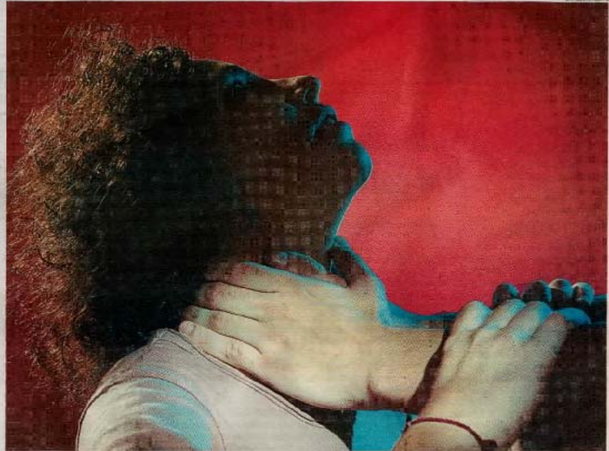
¿MANOS AMIGAS? El choking game comienza por diversión pero puede tener desenlace fatal. Piden que los padres estén atentos.