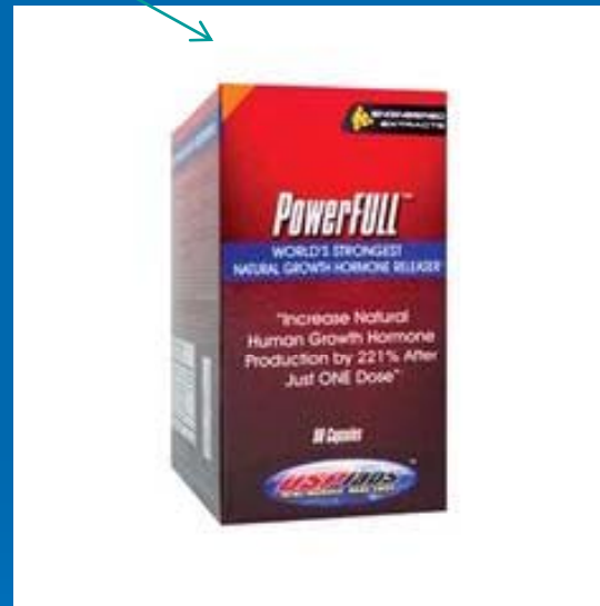
SUPLEMENTO FAVORECER DE EXCRECION DE HGH