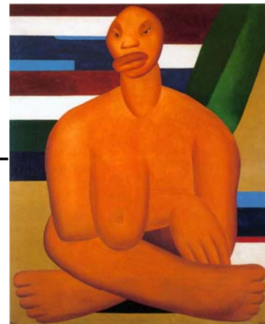
Tarsila do Amaral (1923) A negra .

Raza, clase, género, sexualidad son las cuatro categorías más consideradas, pero en los últimos tiempos distintos movimientos sociales han hecho un llamado a pensar otras fuentes de desigualdad social en el mundo contemporáneo como la nacionalidad, la religión, la edad y la diversidad funcional, por su pertinencia política. Viveros Vigoya M. Debate Feminista 52 (2016) 1–17)