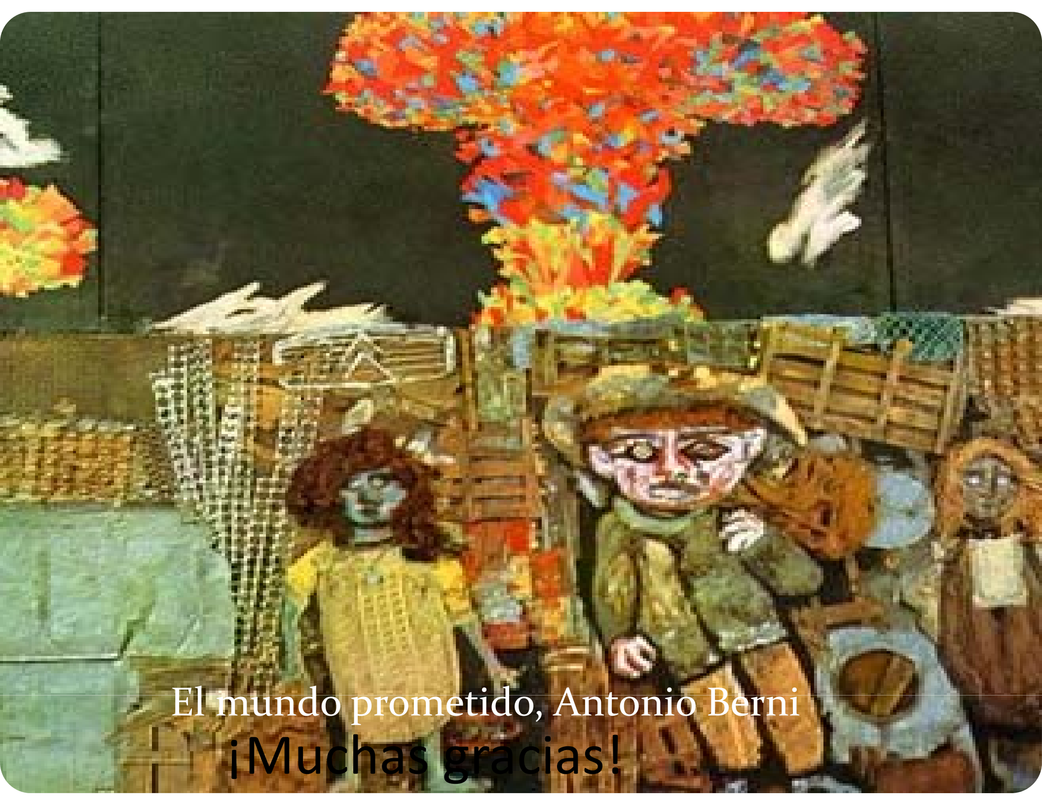
El mundo prometido, Antonio Berni ¡Muchas gracias!