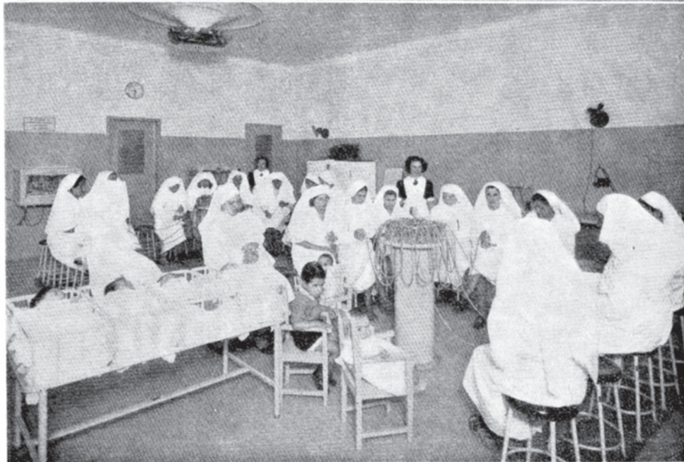
Arriba: Vestibulo del mismo lactario N 3. Puede apreciarse la variedad en condición social de los concurrentes receptores. La entrega de leche materna se efectúa diariamente de 9 a 10 de la mañana