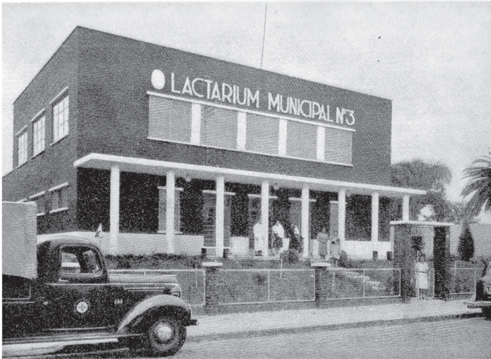
Edificio funcional. Manuela Pedraza 1558, son sus zonas de influencia el bajo de Belgrano, Núñez, Belgrano y algunos de los pueblos suburbanos de la costa del río