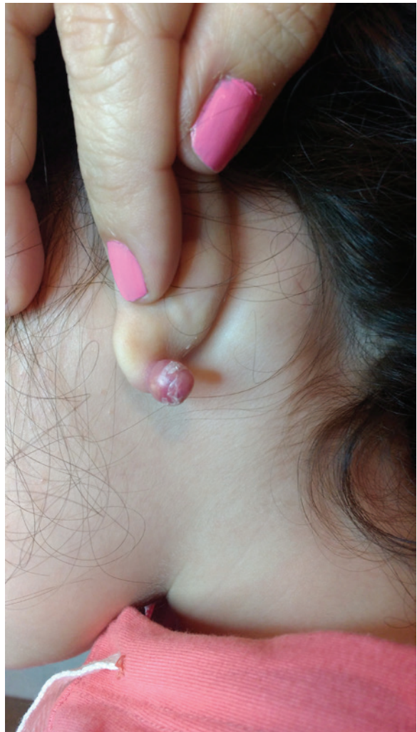
FIGURA 1.b. Evolución de la tumoración